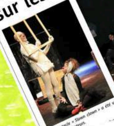
Le spectacle « Slow clown » a été vu par 200 spectateurs.