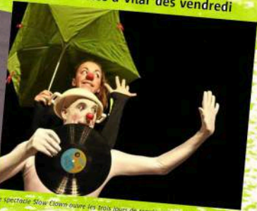
Le spectacle Slow Clown ouvre les trois jours de représentations à Lanester.

Lanester. Trois spectacles à Vilar dès vendredi